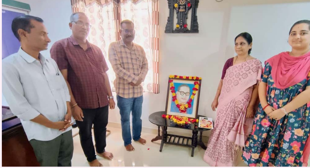
(అంకుశం, అమరావతి, ఏప్రిల్ 14):