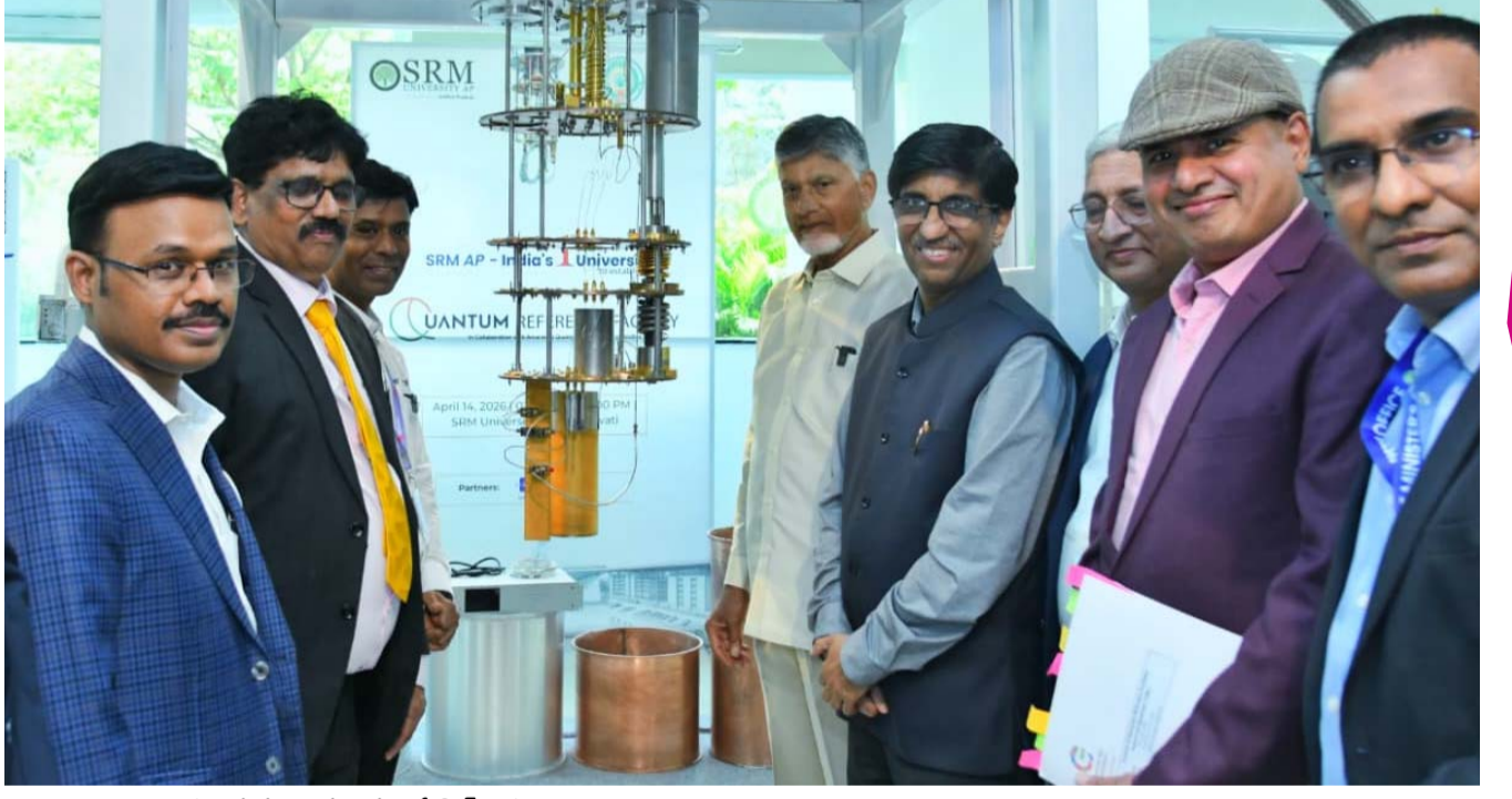
(అంకుశం, అమరావతి, ఏప్రిల్ 14):

దేశంలో తొలి క్యాంటం రిఫరెన్స్ ఫెసిలిటీల ఆవిష్కరణ 1 ఎస్,1క్యూ క్యాంటం టెస్ట్ బెడ్రమ్ జాతికి అంకితం చేసిన సీఎం చంద్రబాబు