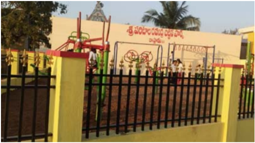
ఉంచుకుని ఈ ప్రాజెక్టును ప్రభుత్వం అత్యంత ప్రతిష్టాత్మకంగా తీర్చిదిద్దింది.

రాష్ట్రం అంకుశం స్టూన్ ఏప్రిల్ 14: మండల కేంద్రం రాష్ట్రం నేడు సరికొత్త అభివృద్ధి హంగులను సంతరించుకోనుంది. నిరుపేదలు, శ్రామిక లోకానికి ఆకలి తీర్చే అక్షయపాత్ర 'అన్నా క్యాంపేన్', చిన్నారుల శారీరక దారుణ్యం కోసం ఏర్పాటు చేసిన 'పరిటాల రవీంద్ర చిల్డ్రన్ పార్క్' నేడు ఘనంగా ప్రారంభం కానున్నాయి. ఈ కార్యక్రమాలకు ముఖ్య అతిథులుగా రాష్ట్రం ఎమ్మెల్యే పరిటాల సునీత, డిడిపి మండల ఇన్చార్జ్ ధర్మవరపు మురళి వచ్చేసి వీటిని ప్రజలకు అంకితం చేయనున్నారు. ?నాడు "ప్రజలే దేవుళ్లు - సమాజమే దేవాలయం" అనే మహోన్నత నినాదంతో అధికారంలోకి వచ్చిన దివంగత ముఖ్యమంత్రి ఎన్టీఆర్, పేదల కడుపు నింపేందుకు రూ.2కోట్ల బియ్యం పథకాన్ని ప్రవేశపెట్టారు. ఇప్పుడు అదే దారిలో, మార్కెట్లో పెరిగిన ధరల దృష్ట్యా సీఎం చంద్రబాబు నాయుడు పేదలకు రూ.5 కోట్ల పథకాన్ని అందుబాటులోకి తెచ్చారు. శ్రామిక శక్తికి 'అక్షయపాత్ర'.. బాల్యానికి 'ఆరోగ్య వనం'!