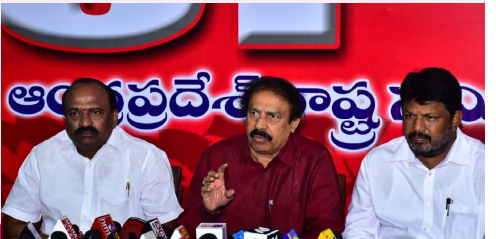
(అంకుశం, అమరావతి, ఏప్రిల్ 7):