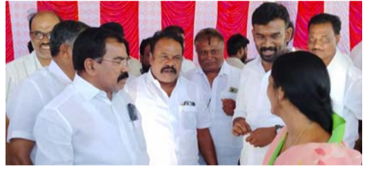
- రామగిరి మండలంలో 560 మందికి పానుపుస్తకాల పంపిణీ

- ఎగువపల్లి మార్కెట్ అమ్మవారి జాతరలో పాల్గొన్న ఎమ్మెల్యే సునీత, శ్రీరామ్, పాపగడ ఎమ్మెల్యే వెంకటేష్