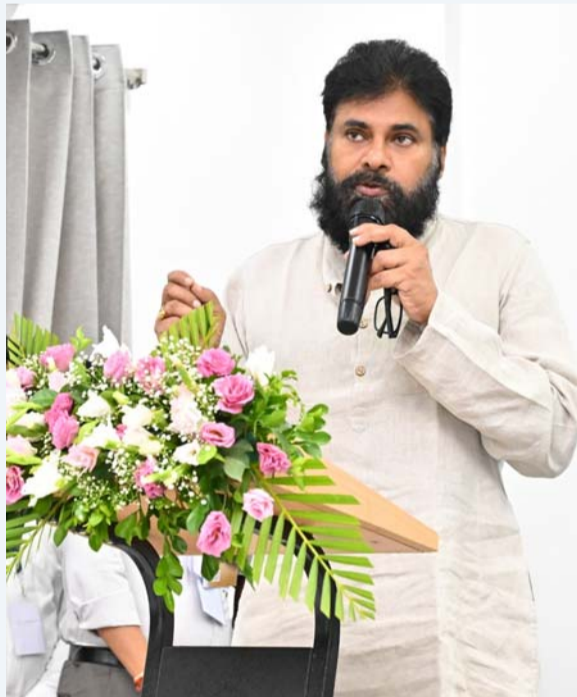
(అంకుశం, అమరావతి, ఏప్రిల్ 7):

100 రోజుల స్పెషల్ డ్రైవ్ కు శ్రీకారం భవిష్యత్తు తరాల కోసం నీటిని కాపాడుకోవడం తప్పనిసరి ఉప ముఖ్యమంత్రి పవన్ కళ్యాణ్