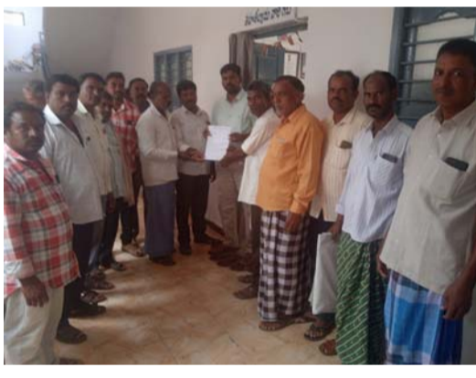
నిర్మించాలని, ఇంటి స్థలం ఉన్నవారికి 6 లక్షల రూపాయలు ఇబ్బ నిర్మాణానికి అందించాలని, అద్దె ఇళ్లలో మగ్గం నేస్తున్న