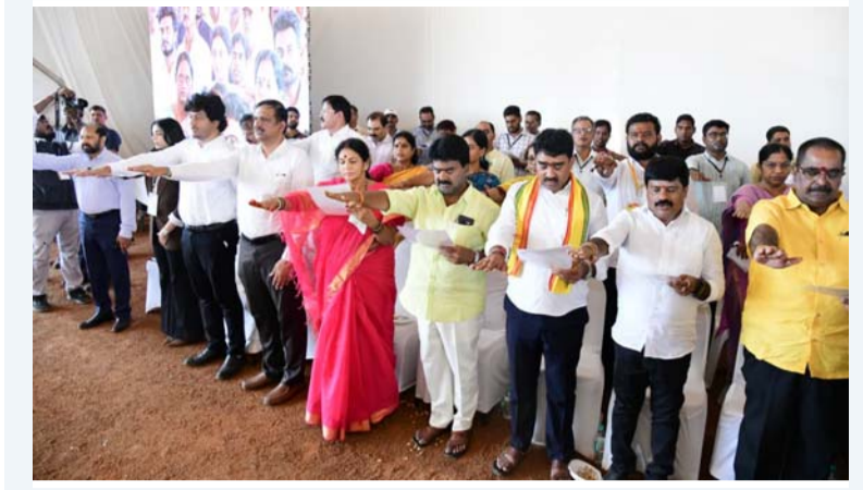
(అంశం, సరసస్మృతి, మే 16):