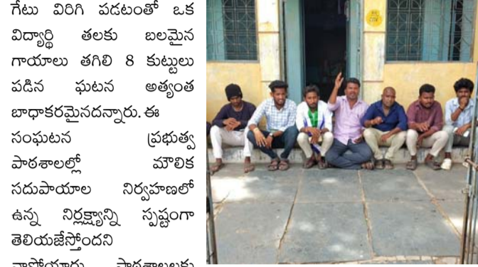
గేటు విరిగి పడటంతో ఒక విద్యార్థి తలకు బలమైన గాయాలు తగిలి 8 కుట్టులు పడిన ఫుటన్ అత్యంత బాధాకరమైనదన్నారు. ఈ సంఘటన ప్రభుత్వ పాఠశాలలో మౌలిక సదుపాయాల నిర్వహణలో ఉన్న నిర్లక్ష్యాన్ని స్పష్టంగా తెలియజేస్తోందిని వాపోయారు. పాఠశాలకు వచ్చే చిన్నారుల ప్రాణ భద్రత విషయంలో నిర్లక్ష్యం వహించడం తీవ్ర ఆందోళన కలిగిస్తోందని, ఈ ఫుటన్పై వెంటనే సమగ్ర విచారణ జరిపి బాధ్యులపై కఠిన చర్యలు