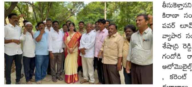
పరోక్షంగా అన్ని వర్గాల వ్యాపార సముదాయాలు పూర్తిగా దెబ్బతిని తద్వారా అసతి కాలం నుంచి వస్తున్న ధర్మవరం చేనేత వైభవం కూడా ప్రమాదంలో పడుతుందని సభ్యులు తెలియజేశారు. ఈ సందర్భంగా మంత్రిగారు మాట్లాడుతూ మీ సమస్య త్రి ప్రత సు అర్థం చేసుకున్నాను, చిన్న మరియు మధ్య తరహా వ్యాపారస్తుల పరిరక్షణ కోసం తొందరలోనే క్యాబినెట్ సమావేశంలో చర్చించి గౌరవ ముఖ్యమంత్రి దృష్టికి