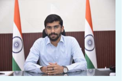
జూన్ 22వ తేదీన కలెక్టరేట్ లో ప్రజా సమస్యల పరిష్కార వేదిక, రెవెన్యూ క్లీనిక్ కార్యక్రమం నిర్వహణ : - జూన్ 22వ తేదీన సోమవారం అనంతపురం కలెక్టరేట్ లో ప్రజా సమస్యల పరిష్కార వేదిక (పబ్లిక్ గ్రీవెన్స్ రీడ్రస్సన్ సిస్టం, పిజిఆర్ఎస్), రెవెన్యూ సమస్యల పరిష్కారం కోసం రెవెన్యూ క్లీనిక్ కార్యక్రమం నిర్వహించడం జరుగుతుందని జిల్లా కలెక్టర్ తెలిపారు. ప్రజా సమస్యల పరిష్కార వేదిక కార్యక్రమాన్ని కలెక్టరేట్లోని రెవెన్యూ భవనంలో ఉదయం 9:00 నుండి నిర్వహించడం జరుగుతుందని, ఈ కార్యక్రమంలో అన్ని శాఖలు జిల్లా అధికారులు పాల్గొంటారని తెలిపారు. సోమవారం ఉదయం 9:00 నుండి పిజిఆర్ఎస్ (గ్రీవెన్స్) డేసు నిర్వహించడం జరుగుతుందన్నారు. ప్రజా సమస్యల పరిష్కార వేదిక కార్యక్రమంలో తమ వివరాలతో పాటు వారి సమస్యలకు సంబంధించి అర్జీలను అందజేయాలన్నారు. అర్ధిదారులు గతంలో ఇచ్చిన అర్జీలకు సంబంధించిన స్లిప్లను తీసుకురావాలని సూచించారు. సమస్య పరిష్కారమైనప్పుడు ఫోన్ కి మెసేజ్ వస్తుందని, అర్ధిదారులు వారి ఫోన్ ను చెక్ చేసుకోవాలన్నారు. నోటీసులు, ఎండార్స్మెంట్ ను చాట్ నెట్ లో పంపిస్తున్నామని, ఎండార్స్మెంట్ బై రిజిస్టర్డ్ పోస్ట్ మీరు ఇస్తున్న అడ్రస్ లు పంపిస్తున్నామన్నారు. అర్జీ ఇచ్చేటప్పుడు దానిని కరెక్ట్ గా దానిని పూరించాలన్నారు. రిపీటెడ్ అర్ధిదారులు పాత రసీదును తీసుకురావాలన్నారు. జిల్లా ప్రజలు పిజిఆర్ఎస్ కార్యక్రమాన్ని సద్వినియోగం చేసుకోవాలని కోరారు. సోమవారం ఉదయం 9:00 నుండి పూర్తి అయ్యే వరకు డివిజన్, మండల మరియు ఎస్.జి.ఎస్.డబ్ల్యూ స్థాయిలో పి.జి.ఆర్.ఎస్. (గ్రీవెన్స్) డేసు నిర్వహించాలని ఆర్.డి.ఓలు, తహసీల్దార్లు మరియు పి.డి.ఓలకు సూచించడమైంది.

- : సోమవారం ఉదయం 9:00 నుండి పిజిఆర్ఎస్ నిర్వహణ.. - : జిల్లా ప్రజలు సద్దినయోగం చేసుకోవాలి - : జిల్లా కలెక్టర్ ఓ.ఆనంద్.. అంకుశం సూన్ అనంతపురం, జూన్ 21 : అనంతపురం జిల్లా అనంతపురం నగరంలోని కలెక్టరేట్లో రేపు 22వ ప్రజా సమస్యల పరిష్కార వేదిక కార్యక్రమం నిర్వహించడం జరుగుతుందని అనంతపురం జిల్లా కలెక్టర్ ఓ.ఆనంద్ తెలిపారు. మే 30 కాలే సెంటర్ 1100 సేవలను వినియోగించుకోవాలని జిల్లా కలెక్టర్ ఓ.ఆనంద్ ఆదివారం ఒక ప్రకటనలో తెలిపారు. అర్ధిదారులు దాఖలు చేసిన తమ అర్జీలు ఇప్పటికీ పరిష్కారం కాకపోయినా, లేదా తమ ఫిర్యాదులకు సంబంధించిన సమాచారం తెలుసుకోవడానికి 1100 నంబర్ కు కాల్ చేయమన్నారన్నారు. అర్ధిదారులు వారి యొక్క అర్జీలు సమాచారం చేసుకోవడానికి Meekosam.ap.gov.in (మీకోసం) డాట్ ఏపీ డాట్ జిఎస్ ఐ డాట్ ఇన్) వెబ్సైట్ నందు వారి యొక్క అర్జీలు సమాచారం చేసుకోవచ్చున్నారు. ప్రజలు ఈ అవకాశాన్ని సద్వినియోగం చేసుకొని తమ సమస్యలకు పరిష్కారం పొందాలని జిల్లా కలెక్టర్ విజ్ఞప్తి చేశారు. రెవెన్యూ పరిధిలోని అన్ని ఫిర్యాదుల పరిష్కార అధికారుల కార్యాలయాలలో “మీకోసం టోల్ ఫ్రీ హెల్ప్ లైన్ నంబర్ 1100” అనే బ్యానర్ ను ఏర్పాటు చేయాలన్నారు.