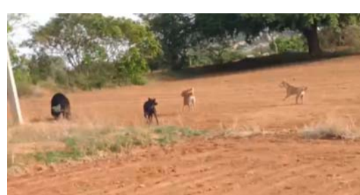
మండల పరిధిలోని సింగిపల్లి గ్రామంలో ఉదయం వీళ్ళ ముంగిట ఎలుగు చొరబడగ గమనించిన గ్రామస్థులు, యువకులు,గ్రామ శుసకాలు వాటిని వెంబడిస్తూ పాలాల వైపు తరిమికొట్టారు.ఇప్పటికైనా వన్యప్రాణు లు అటవీ ప్రాంతంలో తమ కనీస అవసరాలు కరువై గ్రామాల బాట

అంకుశం స్టూన్ మడకళిర .జూన్:21: వన్య ప్రాణులకు ఆహారం, నీరు కరువై సమీప గ్రామా ల వైపు గత్యంతరం లేక అక్కడే తింటున్నాయి.తమ కనీస అవసరాలను తీర్చుకునే సేవల్లో సింగిపల్లి గ్రామంలో ఎలు గుబంట్లు హల్లల్ చేస్తుండ టంతో గ్రామస్థుల్లో భయాం దోళనలునెలకొన్నాయి. ముఖ్యంగా నియోజకవర్గంలోని మొత్తం గ్రామాలు కొండచరి యలకు , అటువి ప్రాంతాల కు అత్యంత చెరువలో ఉం టున్నాయి.దీంతో రాత్రి ,ఉదయం ఎప్పుడు పడితే అప్పుడు వేల పాల్ అన్నది లేకుండా నివాస గృహాల వైపువకు వస్తున్నాయి ఎలుగుబంట్లు .దీంతో చిన్నపిల్లలు, మహిళలు భయంతో వణికి పోతున్నారు.కూత్రి వేళ్లలో అత్యవసర పనుల కోసం బయటకు వెళ్లేందుకు కూడా గ్రామస్థు లు జంతుతున్న దుస్థితి నెలకొనిఉంది.ఆదివారం