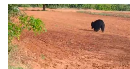
పడకుండా అటవీ శాఖ సిబ్బంది చూడాలని కోరుతున్నారు. ముఖ్యంగా వన్య ప్రాణుల కు వాటి నివాస ప్రాంతం లోనే ఆహారం, నీరు అందు బాటులో ఉండే విధంగా చర్యలు తీసుకోవడంతో పాటు గ్రామాల వైపు రాకుం దా జాగ్రత్త తీసుకోవాలని వేడు కుంటున్నారు.