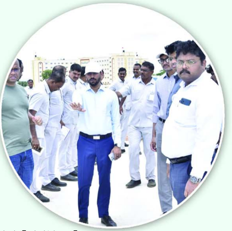
అంకుశం న్యూస్ అనంతపురం, జూన్ 30:

జూలై 01న భారత రాష్ట్రపతి ద్రౌపది ముర్ము అనంతపురం జిల్లా పర్యటన.. ఆంధ్రప్రదేశ్ కేంద్ర విశ్వవిద్యాలయం మొదటి స్నాతకోత్సవానికి ముఖ్య అతిథిగా హాజరుకానున్న భారత రాష్ట్రపతి