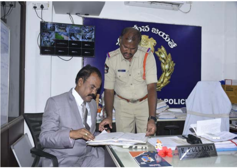
సమాచార హక్కు చట్టం అమలులో నిర్లక్ష్యం వహిస్తే చర్యలు తప్పవు.

రాష్ట్ర సమాచార హక్కు చట్టం కమిషనర్ జి. ఆదెన్న